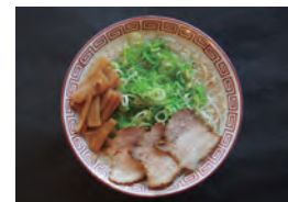
背脂酱油拉面 800 只有京都才有的 猪背部脂肪叉烧拉面