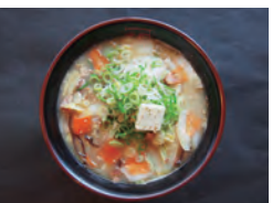
蔬菜拉面 1000 可以补充人体一日所需的蔬菜 的量的半 推荐蔬菜摄入不足的顾客品尝 免费可加黄油 采用时令蔬菜

加料 生大蒜：免费 大份：+200 可以换成极细面 生鸡蛋：+50 酱油煮鸡蛋：+100